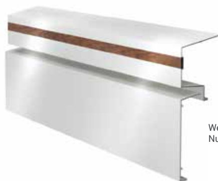
Weiß mit Nussbaum-Einsatz

Es ist eine moderne Kollektion, die eine individuelle Anordnung der Flügel nach Vorlieben ermöglicht. Wir können zwischen verschiedenen Materialien, Edelh Holz, rostfreiem Stahl und Kunststoff in verschiedenen Farben wählen. Alle Materialien können in die speziell vorbereitete Aussparung im Flügel angebracht oder bereits fertig gekauft werden.