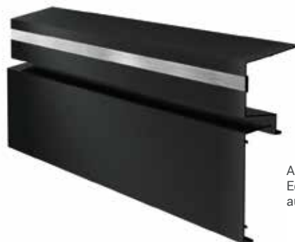
Anthrazit mit Edelstahl-Einsatz aus rostfreiem Stahl